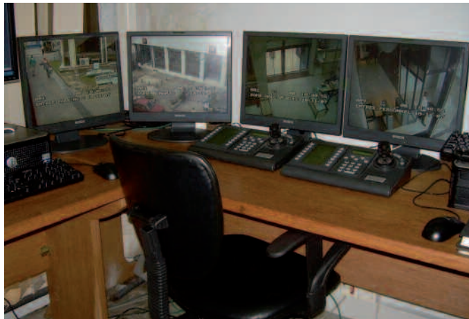
Une vue du poste de contrôle de surveillance.

ment qui peut entrer où, à quel moment et à quelles conditions «Vous ne pouvez pas avoir accès à un bureau si vous ne disposez pas de votre badge personnalisé. Ce qui est intéressant à ce niveau est le fait que cela évite des pertes de temps inutiles, les gens sont désormais contraints de rester à leur poste de travail, et de ne se déplacer que s'il y a vraiment nécessité.» La carte d'accès limite les possibilités de déplacement aux