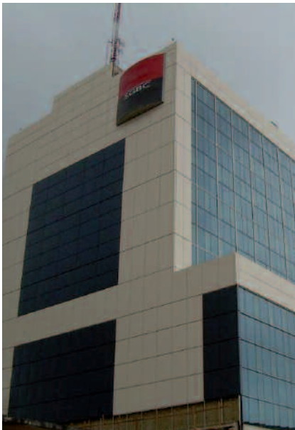
Le bâtiment sécurisé de la Sgbc