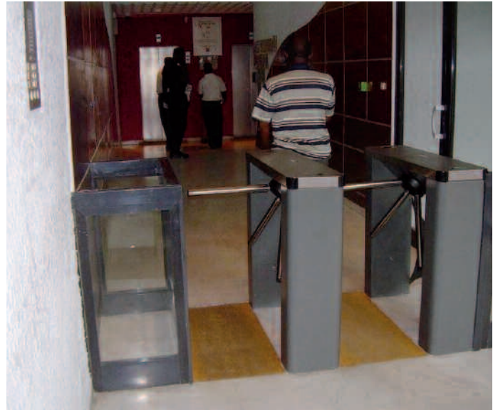
Vue du contrôle d'accès par tourniquet tripode

Selon les responsables de la société générale des banques au Cameroun (Sgbc), le choix de IDtech pour sécuriser cet établissement bancaire se justifie: «IDtech propose aux entreprises et aux institutions publiques, une solution complète et intégrée de gestion de la sécurité et du personnel. Elle propose et développe une gamme complète de produits qui allient matériels et logiciels de gestion pour optimiser la sécurité des sites et la gestion du temps du personnel. Elle offre également une gamme de services allant de l'analyse des besoins lors de l'élaboration du projet en passant par la formation personnalisée, par l'aide à la paramétrisation de la solution, pour aboutir au suivi de l'installation. Ce sont des valeurs ajoutées importantes qui correspondent aux normes de sécurité