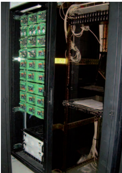
Vue de la baie du contrôle d'accès

Un tour dans le poste de contrôle et de surveillance (Pcs) installé dans les locaux de la Société Générale des banques au Cameroun permet d'apprécier la longueur d'avance prise par IDtech dans le domaine de la vidéo surveillance. Le système permet, grâce à une dizaine de moniteurs, de visualiser les accès principaux et surtout les zones sensibles. Sur un moniteur l'on a une vue claire de la salle principale des opérations bancaires. Les agents en charge de la sécurité de la banque peuvent ainsi repérer tous les mouvements suspects. Toujours grâce aux moniteurs de contrôle, le responsable de la banque peut savoir la position de tel ou tel agent dans l'enceinte de l'établissement. «C'est un système révolutionnaire. Imaginez vous que je peux à mon niveau savoir combien une caissière a remis à un client. Mieux, avec mon moniteur, j'ai l'oeil sur tout ce qui passe dans les parages de la banque.»